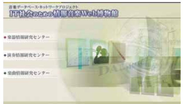
写真7. 大阪芸術大学通信教育部音楽学科 Webサイト「IT社会のための情報音楽 Web 博物館」(トップページ)