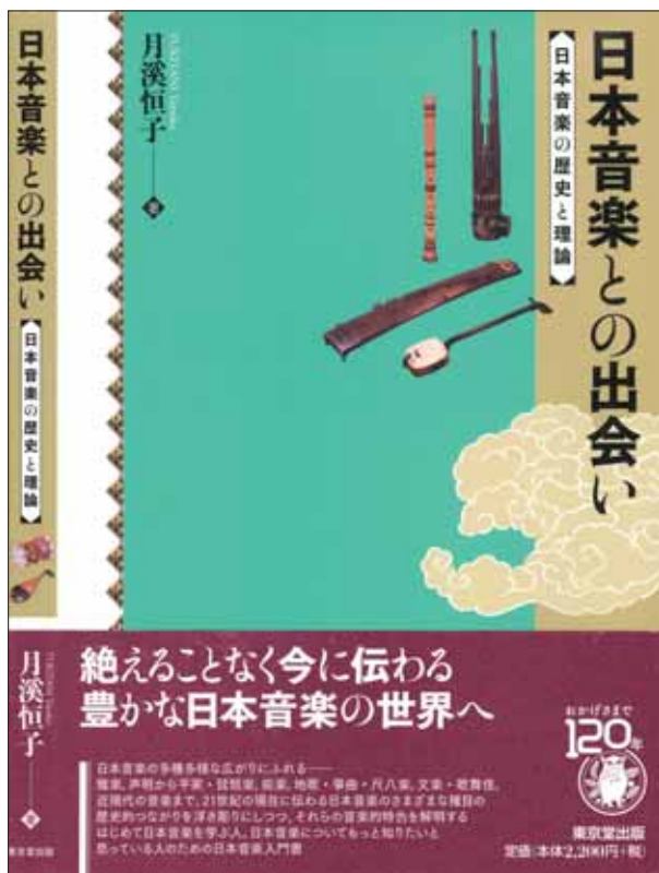
写真4. 月溪恒子著『日本音楽との出会い 日本音楽の歴史と理論』(東京堂出版)

ところで、おそらく先生が最初に公にされた論文は、「尺八古典本曲の研究 - 構成法について」『音楽学』第15巻(一)、音楽学会、(1969) だと思いますが、これは、前年度に東京藝術大学大学院音楽研究科音楽学課程学位論文(修士)として提出されたものでした。先生はあるとき「大学でのゼミを選ぶときに、はじめは柴田南雄先生のゼミで現代音楽の研究がしたかったけれども、前述の諸井誠先生の尺八曲誕生に関わったご縁から、小泉文夫先生のゼミに配属され、尺八研究をする破目になった」と何度か言っておられました。これが、良かったということなのか、残念だったということなのか、今となっては、直接お聞きすることはできませんが、私はいつも「良かった」とおっしゃっておられると勝手に解釈しておりました。「破目になった」という表現は、若干の照れかご謙遜があつてのことで、実はこれらのことは卒業論文ですでに「尺八古典本曲」をテーマにされた後、自己の意思で修