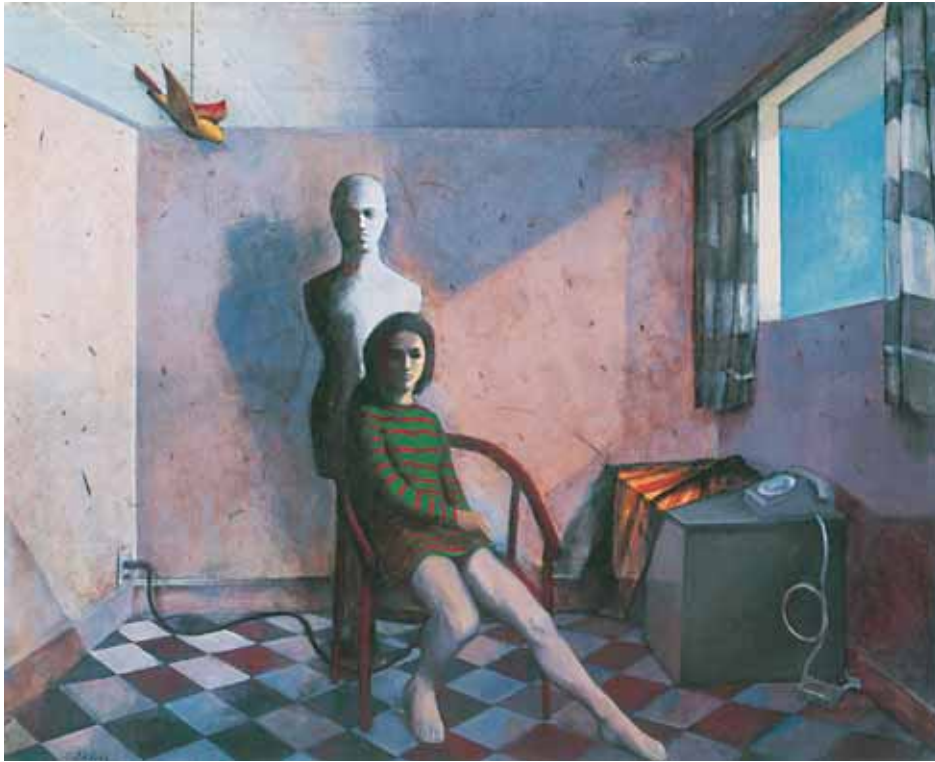
室内, 油彩・カンヴァス 1974年