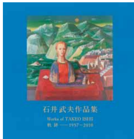
石井武夫作品集 (生活の友社、2010年11月刊)