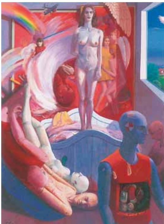
アトリエの朝, アクリル・油彩・カンヴァス 2003年