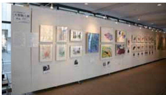
図3 アーツアンドエイブス展に出品された大型類人猿の描いた絵画