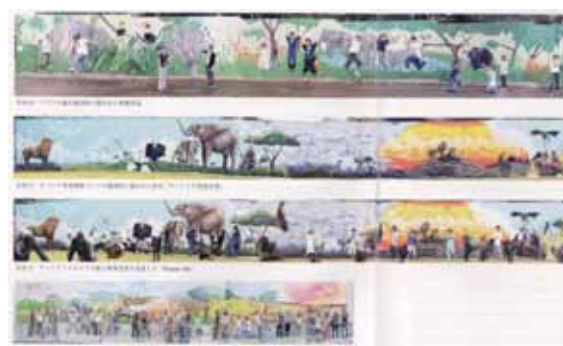
図5 天王寺動物園の工事の際に描かれた壁画