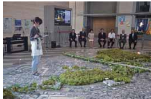
図15 藤井寺市を世界遺産のまちへ「緑と歴史の回廊」展