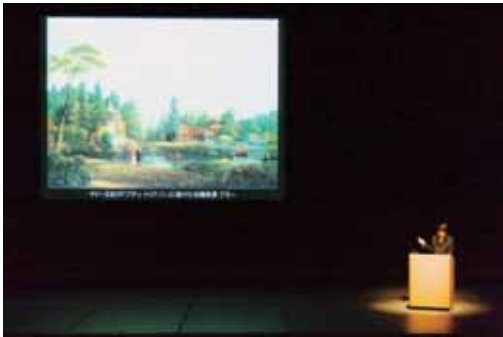
図9-10 日本造園学会全国大会で上演された 舞台公演 「庭園の響き」