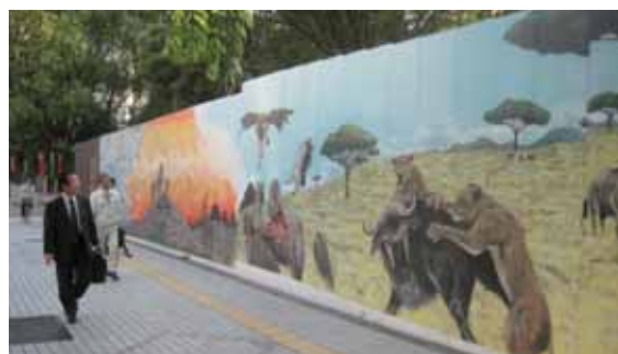
図6 谷町筋沿いに設置された天王寺動物園での鋼板塀の描画作品