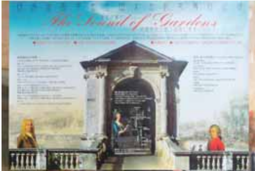
図8 「庭園の響き」のポスター