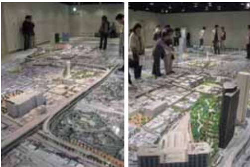
図11 なんばパークスで開催された巨大模型でのメディア プレゼンテーション「土に遊ぶまち」