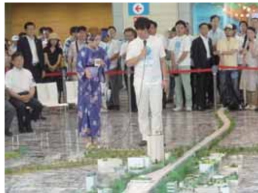
図14 橋下知事の前でプレゼンする学生「風と緑の回廊」展