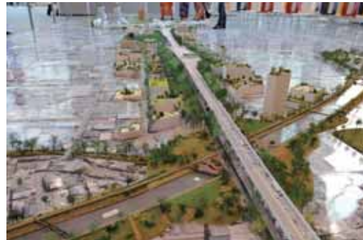
図12上、13下 大阪府の依頼で提案した「風と緑の回廊」展