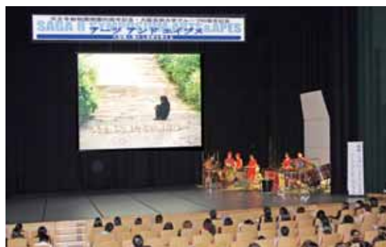
図4 SAGA シンポジウム アーツアンドエイブス展での舞台公演