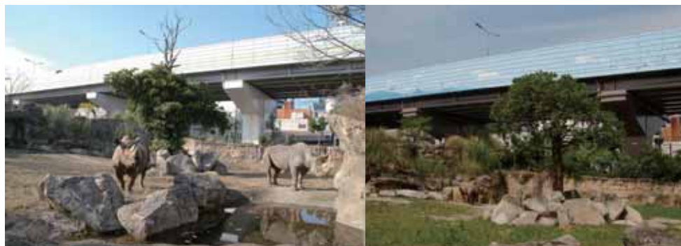
図7 阪神高速道路に描かれたサバンナの空の壁画(左描画前)