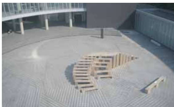
図2 アーツアンドエコロジー2005に出展した「かくれた次元」