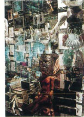
●ポーランドブースの中は一面鏡