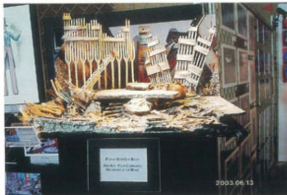
●セノフェストのリア王

スペースはスクールセクションほど広くないものの、プログラム上は参加学生と演出家や舞台美術家との活発なディスカッションが持たれた。まさに参加学生にとっては生きた学習であったと、日本から参加した玉川大学の副手と大学院生から帰国後報告を聞いた。ナショナルもスクールセクションも、一つの戯曲にこだわって展示するものではない為、比較研究する事は容易ではないが、少なくともシェークスピアの「リア王」に限れば、観客にとっても比較して見ることが出来て、興味が深まるに違いない。