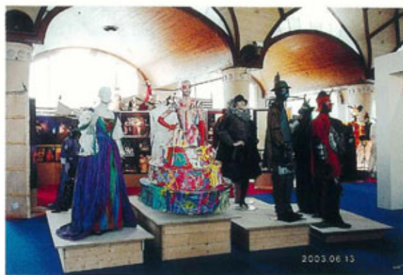
●コスチュームレーンに飾られた舞台衣装の数々