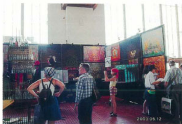
●ロシアブースはボリス・メッサラ氏の回顧展

さて日本は残念ながら、厳しい予算の中での出展。十分な費用をかける事が出来ず、渡航参加した学生達