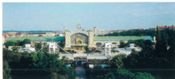
●産業宮殿ストロモフカ公園からの全貌

プラハカドリエンナーレの沿革については、紀要23号に記しているが、その主旨は過去4年の舞台上演作品の中から、各国選抜作品の展示を行い、最も優れた展示国と舞台美術家の仕事に与えられるゴールドトリガーとゴールドメダルを競うことにある。