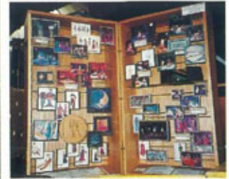
●アメリカブースのトランクの中の作品