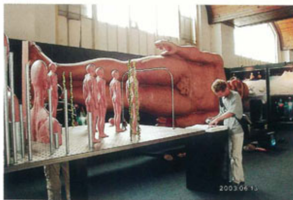
●ラトビアブースは人体をモチーフにしたセット展開