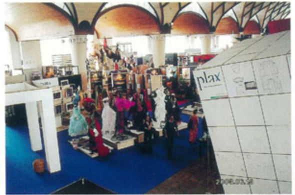
●右手前の白い造形はハンガリーブース、最奥にギリシャブースの衣裳が見える