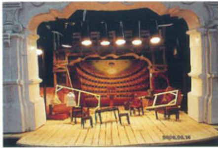
●ルーマニアの模型作品