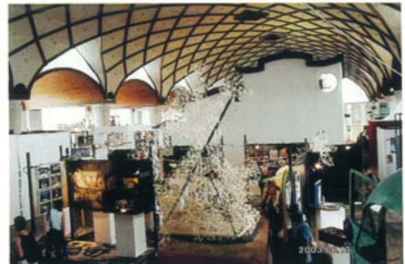
●台湾ブースを借景にした日本ブースと割り箸のオブジェ