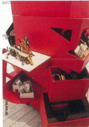
●ギリシャブースと習作の模型作品