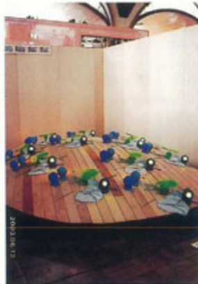
●デンマークブース