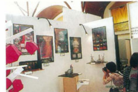
●日本ブース、大阪芸大の作品