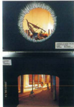
●イギリスの模型作品