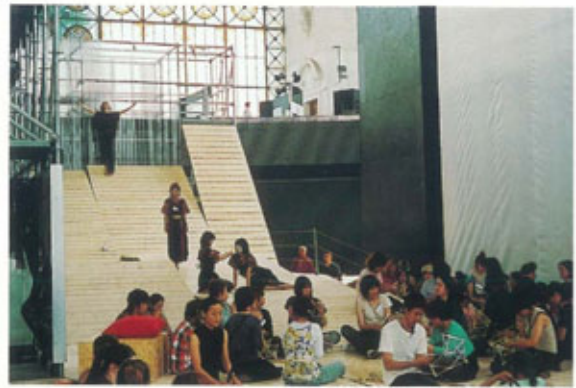
● ジャパンディのイベントに参加した学生達