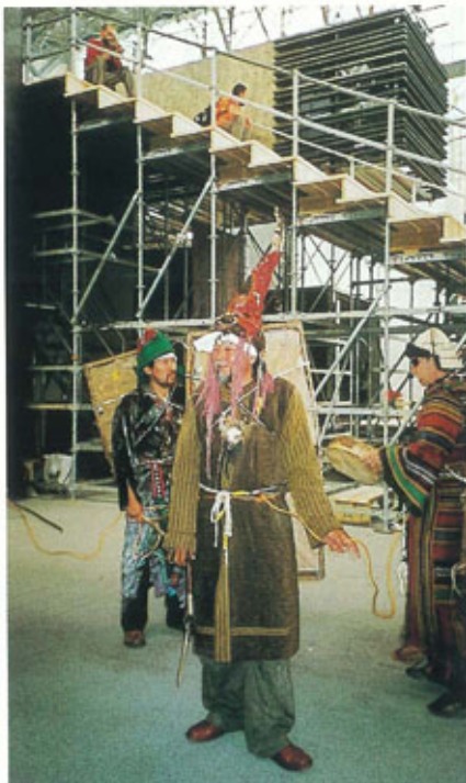
●ハート・オブ・PQ/カザフスタンのパフォーマンス