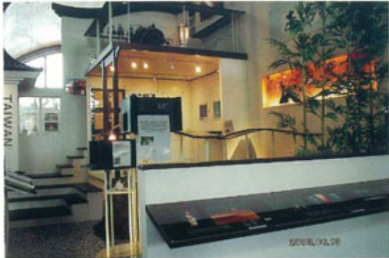
●アジアテイスト溢れる台湾ブース