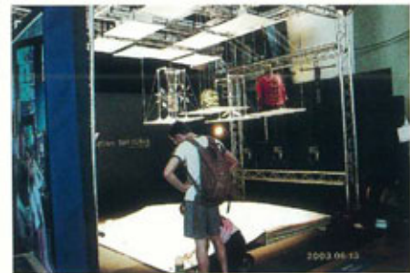
●ベルギーブースは昇降装置付き