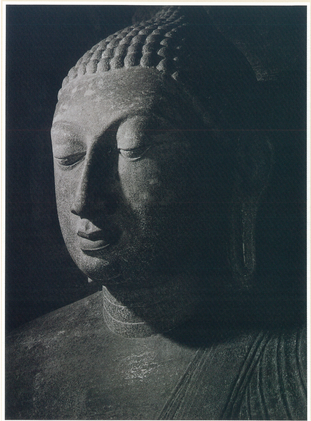
(17) ガル・ヴィハーラ 禅定印仏坐像 (12世紀)