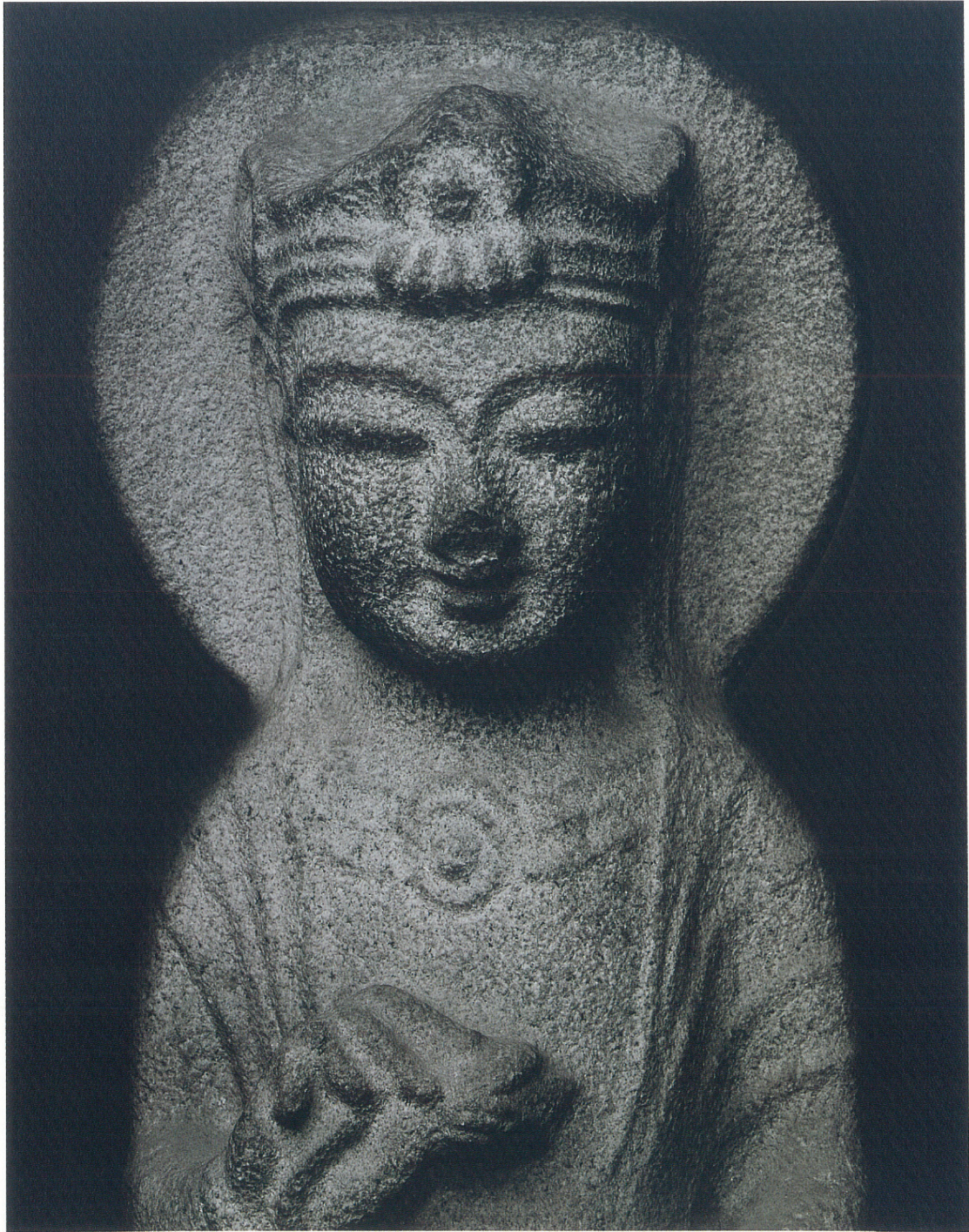
(12) 菩薩立像 (部分) (7世紀中頃)