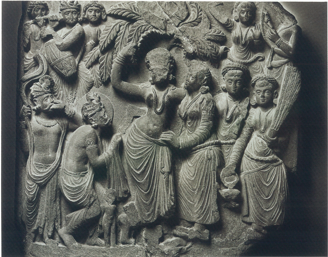
(4) 「誕生と七歩」(2世紀後期)