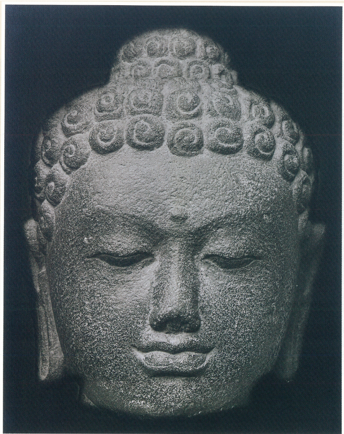
(15) 仏頭 (8~9世紀)