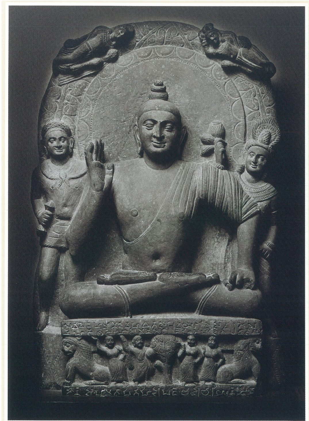
(2) 仏坐像 (2世紀後期)