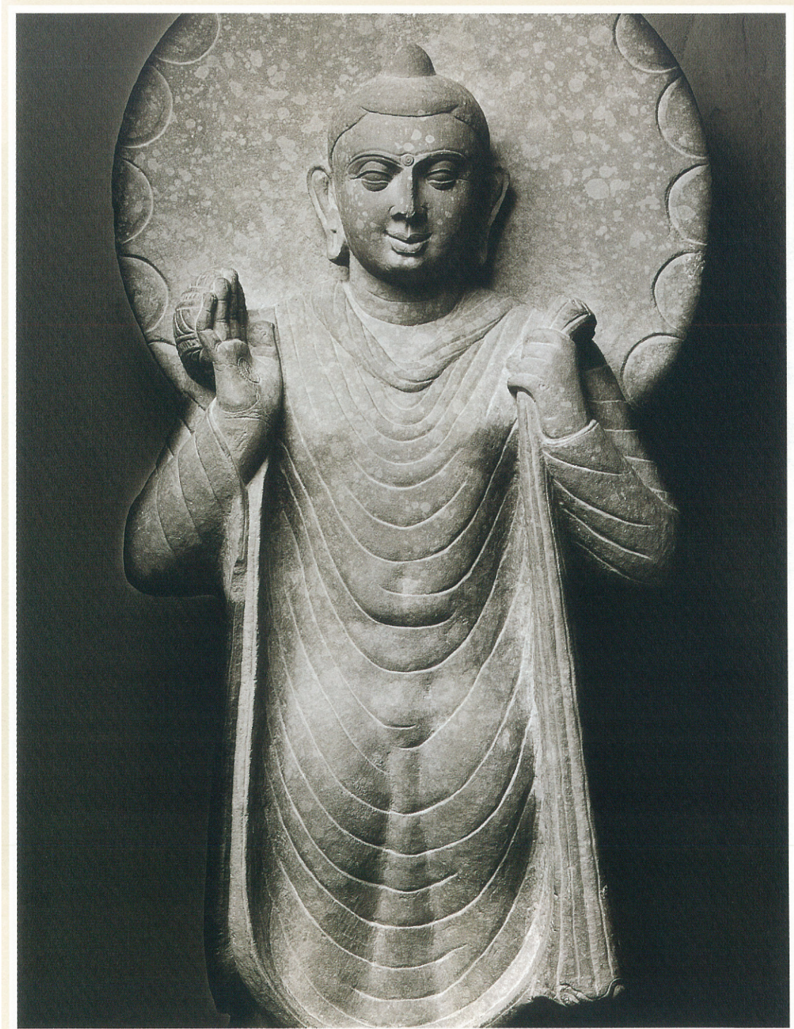
(5) 仏立像 (部分) (2世紀末期)