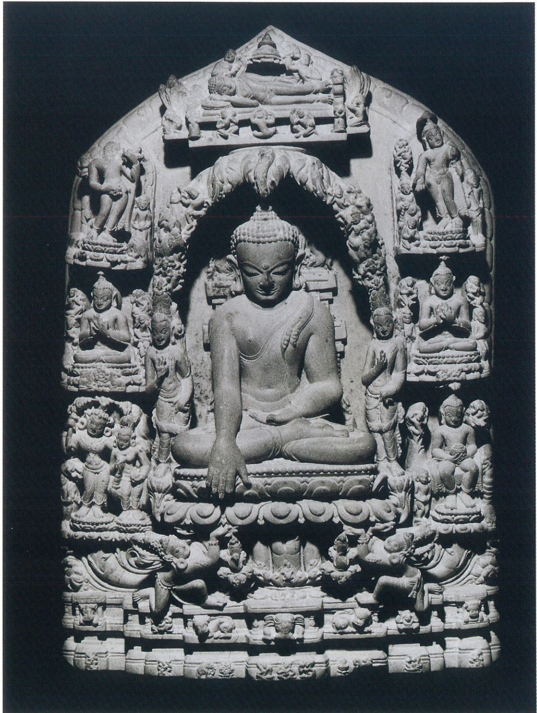
(16) 触地印仏坐像と仏伝の諸場面 (11~12世紀)