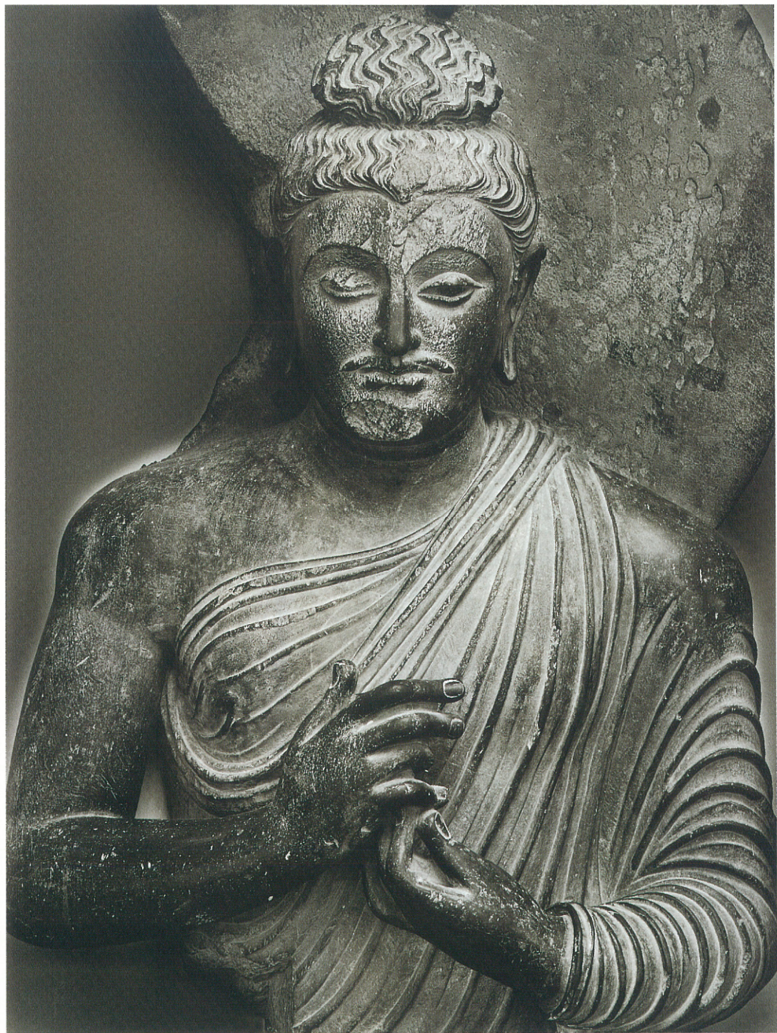
(6) 釈迦 (2~3世紀)