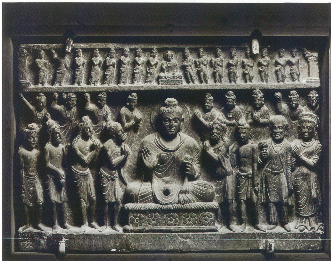
(9) 迦葉兄弟に礼拝される釈迦 (3~4 世紀)