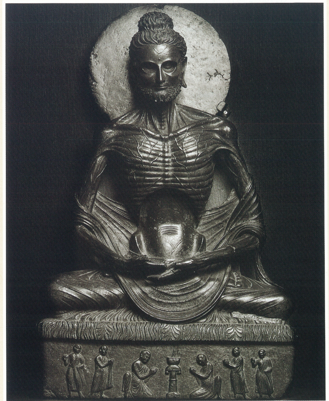
(1) 苦行釈迦像 (2世紀)