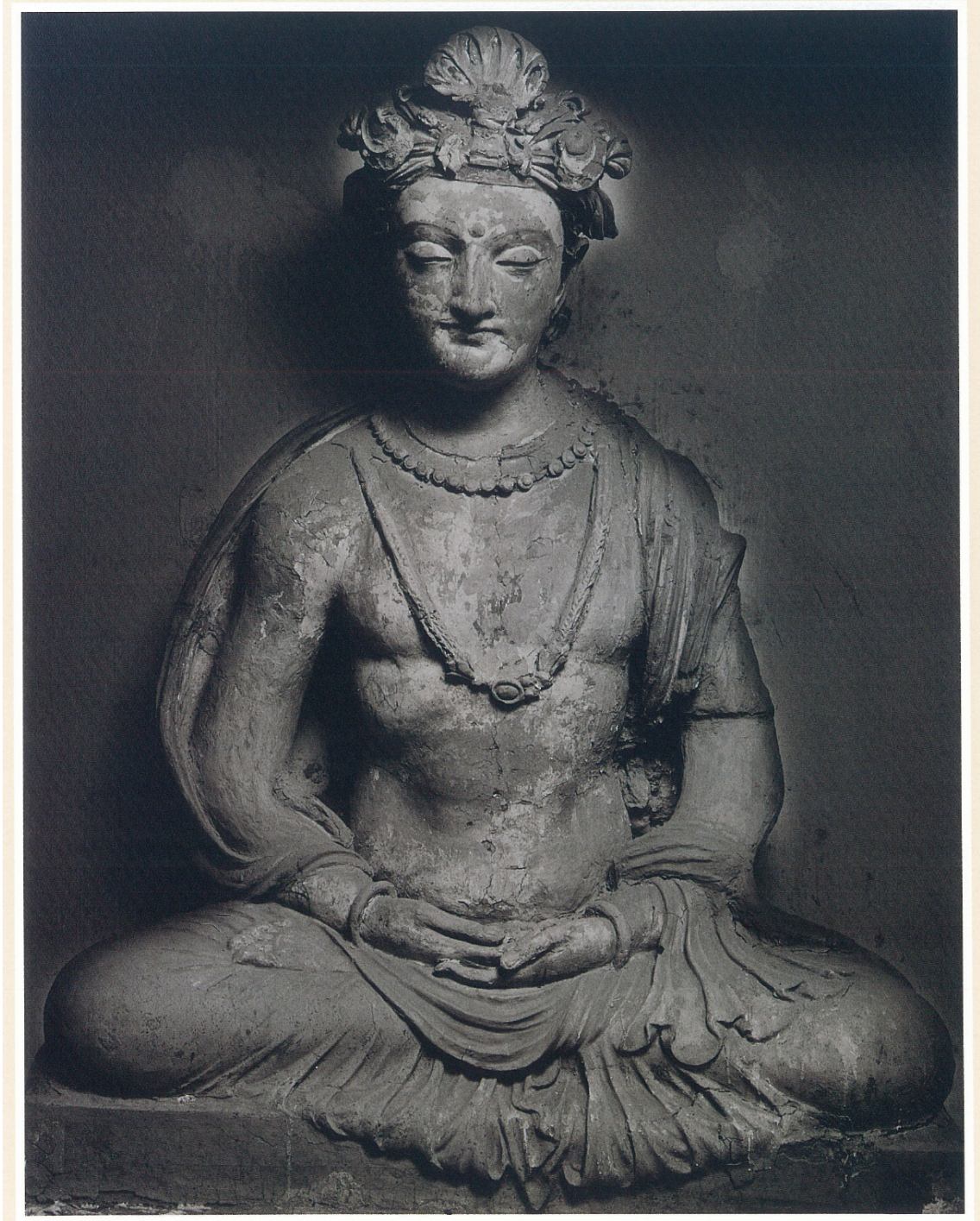
(11) 菩薩坐像 (5~6 世紀)