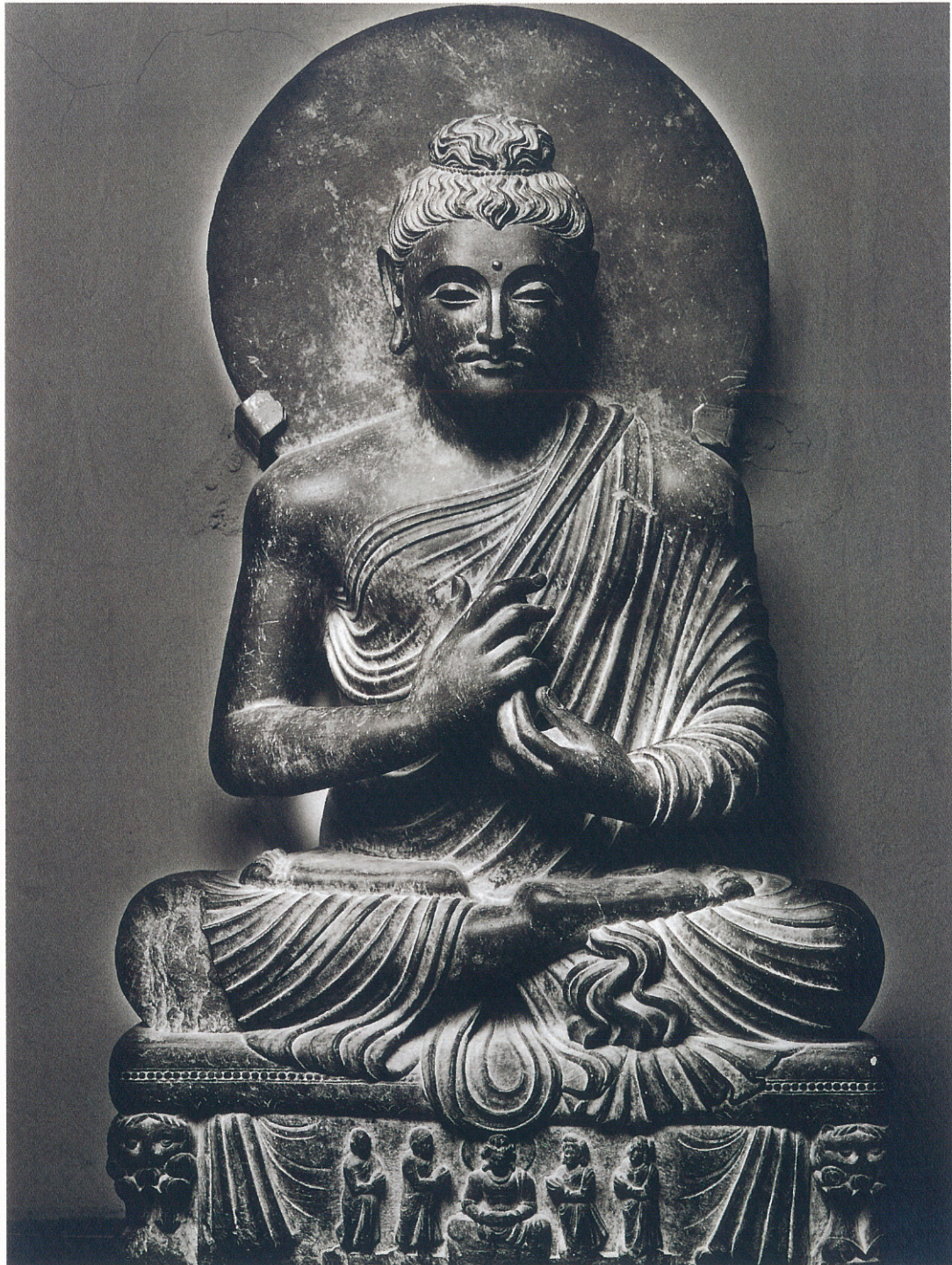
(7) 釈迦坐像 (2~3 世紀)