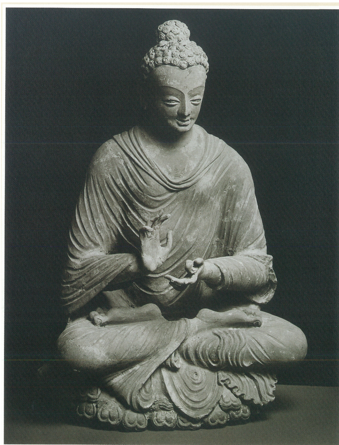
(13) 仏坐像 (7~8 世紀)