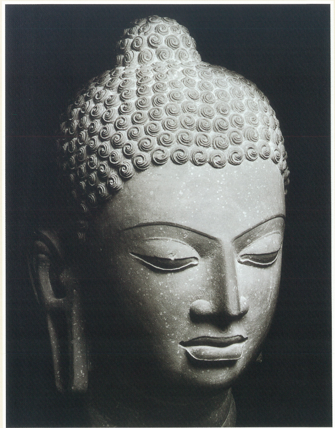
(10) 仏 頭 (5 世紀中期)