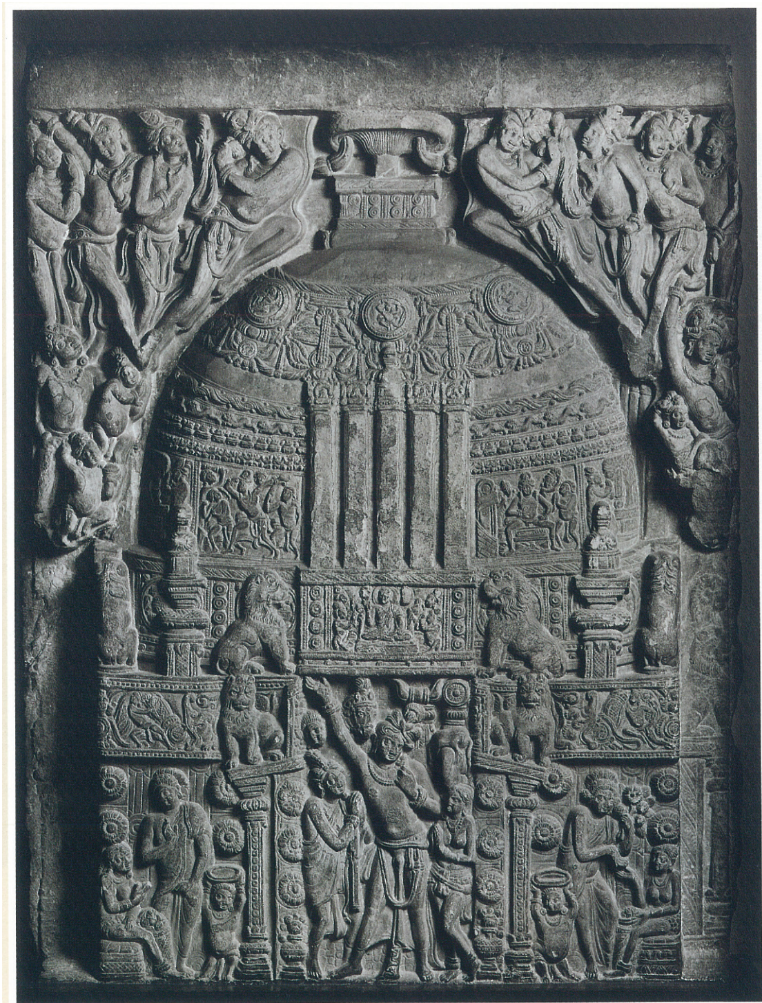
(8) 墓壇飾り板「ストゥーバ供養」(3世紀後期) ニューデリー国立博物館(インド)