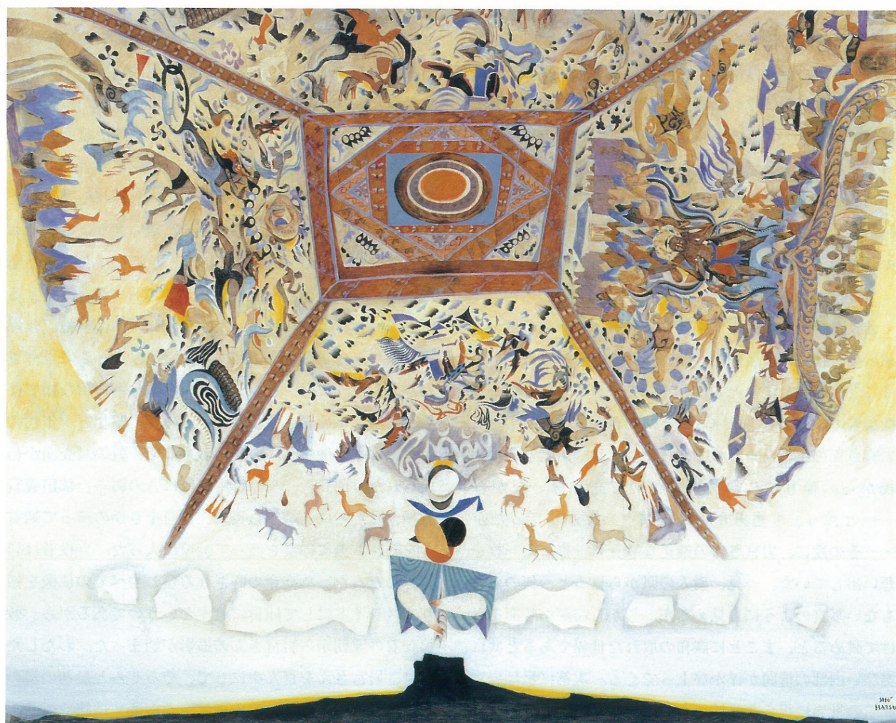
松井 正「敦煌の空」 1984年 181.8×227.2 cm

だが、数日後、調査が終ってバスが莫高窟から遠ざかるや否や、岩宮さんはいつもの快活な風貌を取り戻していた。私に近寄り、私の肩をポンとたたき、「せんせ、敦煌の記録は書いてや」というや否や、バスを止め、多分、莫高窟全体の丘と背後の山並みを撮るためだろう、全速力で砂漠の中をかけて行った。