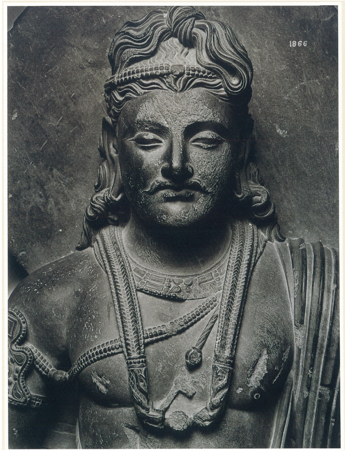
(3) 弥勒菩薩立像 (2世紀後期)